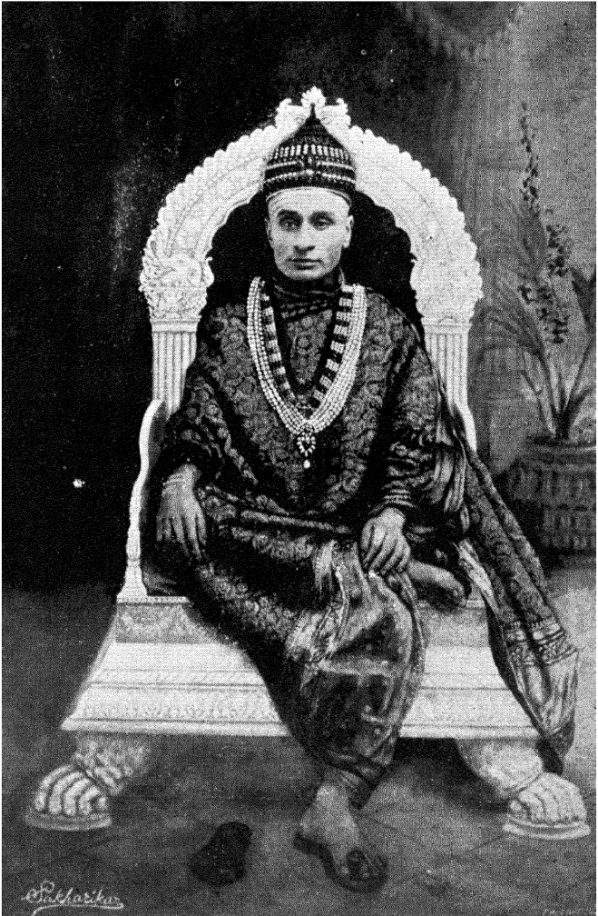
ಶ್ರೀಮತ್ಪರಮಹಂಸಸರಿವ್ರಾಜಕಾಚಾರ್ಯೇತ್ಯಾದಿಬಿರುದಾಂಕಿತ ಶ್ರೀಮತ್ಪರಸೀರ ಸಿಂಹಾಸನಾಧೀಶ್ವರ ಶ್ರೀಜಗದ್ಗುರು ಶಂಕರಾಚಾರ್ಯ ಶ್ರೀನಿವ್ಯಾಶಂಕರಭಾರತೀಸ್ವಾಮಿಗಳು.