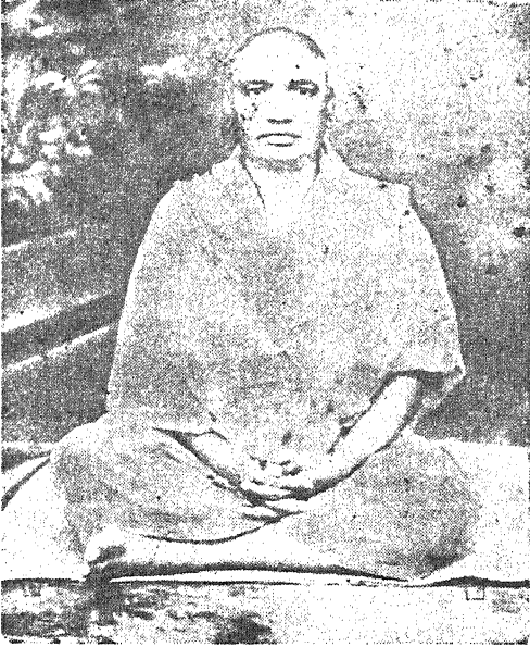
ಶ್ರೀ ಶ್ರೀ ಶ್ರೀ ರಾಮಕೃಷ್ಣಾನಂದಜಿ