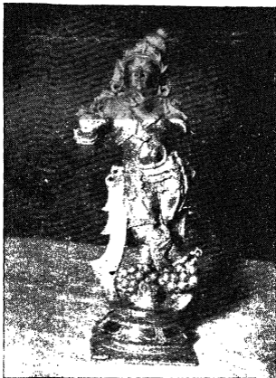
ದಾಸರಿಂದ ಆಚಾರ್ತನಾದ ಶ್ರೀದವಿತಲರಿಗೆ ಒಲಿದು ನಲಿದ ಶ್ರೀ ಮುರಳೀ ಕೃಷ್ಣ