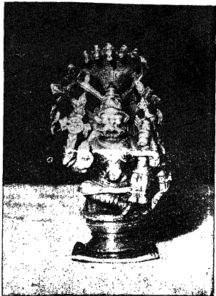
ದಾಸರು ಪೂಜಿಸಿದ ನರಸಿಂಹ ಮೂರುತಿ