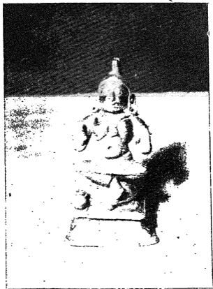
ದಾಸರು ಆಚರಿಸಿದ ಶ್ರೀ ವೇದವ್ಯಾಸ ಮೂರುತಿ