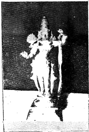
ದಾಸರು ಅರ್ಚಿಸಿದ ಶ್ರೀದವಿಠಲರಿಗೆ ಒಲಿದ ಶ್ರೀರಾಮ