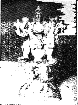
ದಾಸರು ಪೂಜಿಸಿದ ಶ್ರೀಕರಮೂರುತಿ