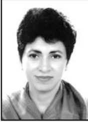
Dr. Ambedkar KUMARI SELJA