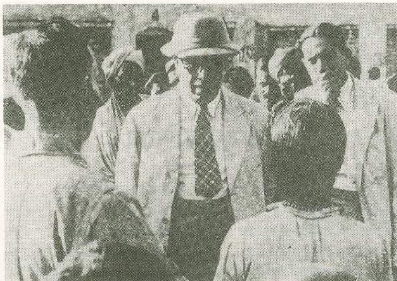
9 दिसम्बर, 1943 को कोयला खनन क्षेत्र के दौरे पर कोयला खान के मजदूरों से बातचीत करते हुए माननीय डा. बी.आर. अम्बेडकर