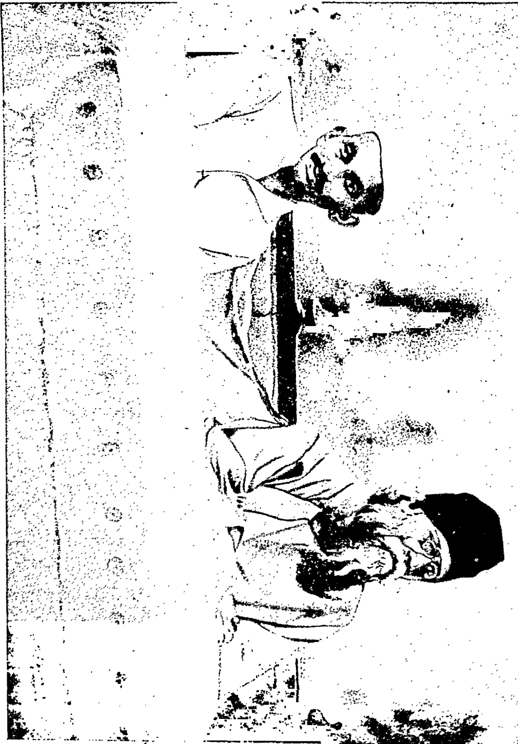
गंधीजी और गुलदेव, अहमदाबादमें (अप्रैल, १९२०)