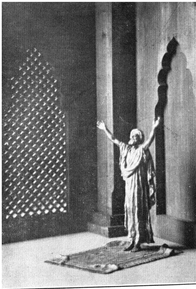
ಅಲ್ಲಾ ಹೋ ಜ್ವರ