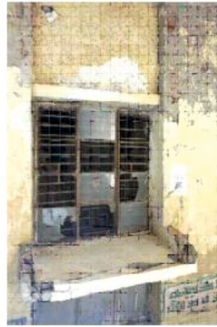
Picture of Delhi Government Schools in Najafgarh. The school is not only in a dilapidated condition but is also poses questions on the safety of children and teachers.

corruption-free government. A CM who hails himself as an RTI activist turned into the nemesis of the RTI in Delhi. There have been several instances where it has been found that the CMO has denied the request or simply disposed of RTI without even giving a proper reply. ii