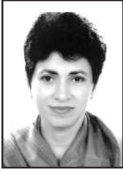
dekhj l sytk KUMARI SELJA