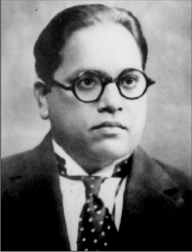
बाबासाहेब डॉ. बी. आर. अम्बेडकर